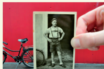
Flâneur: © Anna Margit Erber, Evelyn Rendi, 2010

ist ein transdisziplinäres wissenschaftliches Masterstudium (4 Semester), das sich aus den Fächern Medientheorien, Kunstgeschichte/-theorie, Gender Studies und Kulturwissenschaft zusammensetzt. Im Studium werden die Relationen medialer, künstlerischer und kultureller Ausdrucks- und Nutzungsformen sowie ihre Wahrnehmung untersucht, historisiert und diskutiert. Dabei werden Theorie und Praxis, Analyse-, Recherche- und Gestaltungsverfahren miteinander verknüpft und künstlerisch-wissenschaftliches Forschen erprobt.