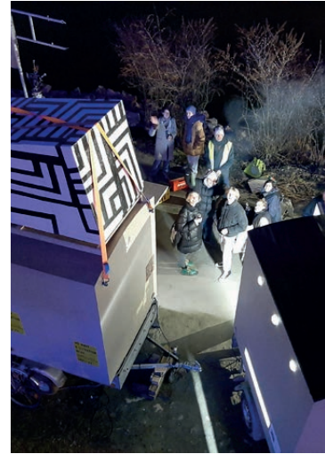
Seminar: Bildtales, 2022 © Amalia Barboza

study, question, act - reinterpreting history, reshaping the future