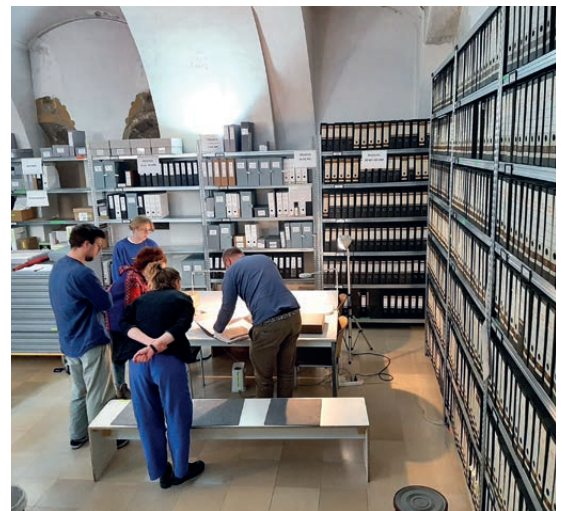
Exkursion nach Wien, Volkskunde Museum, 2022 © Amalia Barboza