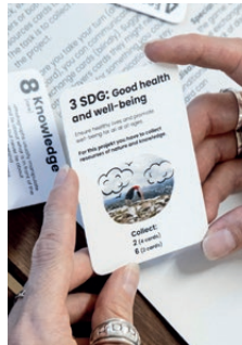
Theatre of Making Telematic Improv. Workshop