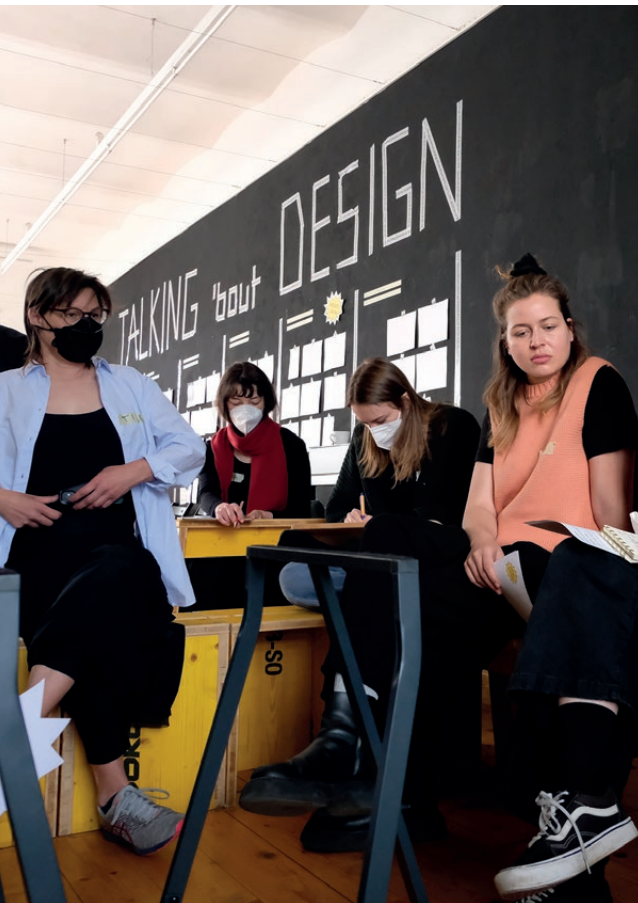
Talking 'bout Design Workshop im WEISRAUM Innsbruck

In addition to interdisciplinarity, the Visual Communication master programme focuses on the integration of design, art, and personally engaged artistic research.